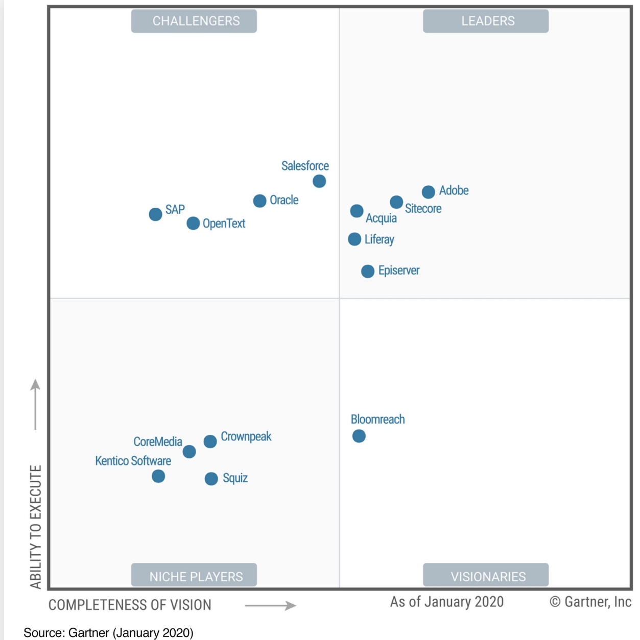
Figure 1. Magic Quadrant for Digital Experience Platforms